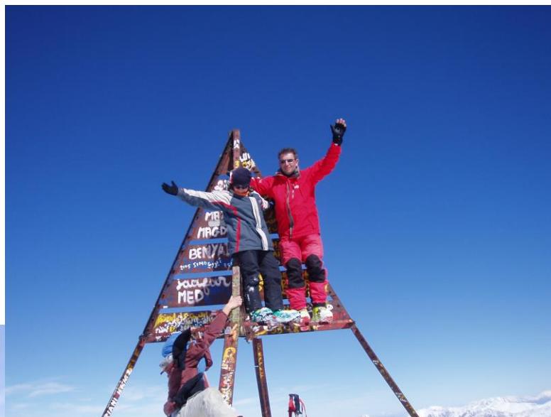
Le parc national du Toubkal

Au sud de Marrakech, à soixante kilomètres à peine, le massif du Toubkal fait partie du Haut Atlas de Marrakech, massif ancien constitué de granits et de lave (andésite et rhyolite) datant de l'ère primaire, rehaussé au tertiaire et travaillé par les glaciers au quaternaire ; les laves sombres et brunes du cœur du massif lui confère un relief vigoureux et austère. Entouré de paysages de roches sombres torturées, et de pics à l'assaut du ciel, l'Atlas est le territoire des montagnards berbères chleuh.